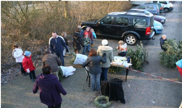
Kerstbomeninzamelactie een echt kinderfeest